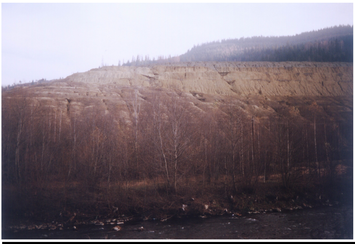
Foto 1. Halda de steril formată pe locul fostului iaz de decantare

Uzina de preparare care conferă acestui sat de munte aspectul unei zone industriale părăsite este în prezent dezafectată, singurii angajați sunt reprezentați prin personalul de pază. Într-un stadiu avansat de degradare, improprie locuirii, în prezent, se află și locuința colectivă, destinată minerilor care proveneau din alte zone.