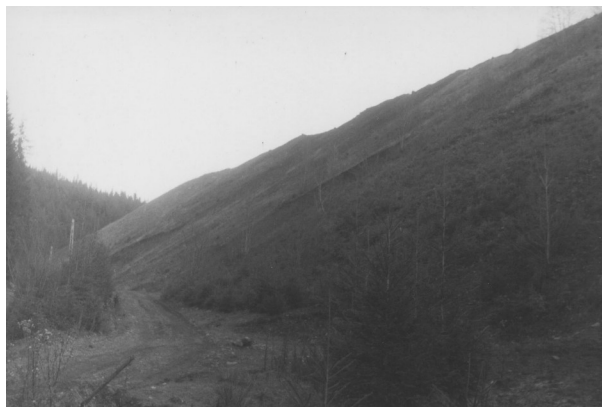
Fig. 4 Haldă de steril din perimetrul minier Oița.

haldelor este de 20°, iar înălțimea între 20 și 70 m. Haldele sunt parțial stabilizate, necesitând lucrări de ecologizare.