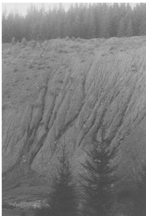
Fig. 6 Procese geomorfologice active.

Poluare aerului se realizează prin emisiile de praf de pe haldele de steril și cele de gaze legate de procesul de pușcare, transport auto, măcinare și semipreparare a minereului (perimetrul minier Tolovanu). Datele prezentate au dovedit că de fapt toate aceste activități și procese sunt generatoare de emisii (de praf, gaze), dar ne semnificative din punct de vedere cantitativ și calitativ, nivelul concentrațiilor fiind sub limitele maxime admise.