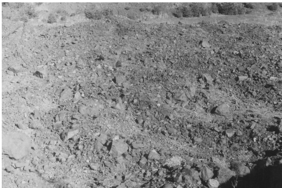
Fig. 7 Zonă contaminată cu minereu de mangan.

În concluzie, din cele prezentate mai sus, rezultă că prin natura procesului de exploatare desfășurat în cadrul perimetrului nu există riscul poluării semnificative a solului, nivelul concentrațiilor în elemente nocive solului fiind mai mici decât pragurile de alertă impuse prin Ord. 756/1997 al MAPPM.