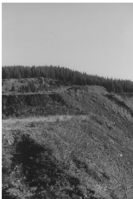
Fig. 2 Haldă de steril din perimetrul minier Dadu.