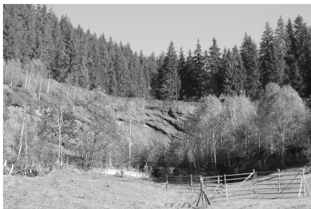
Fig. 3 Haldă de steril din perimetrul minier Tolovanu.

Suprafața ocupată de haldele de steril rezultate din perioada de explorare și exploatare este de aproximativ 5 500 m 2 (Fig. 3). Haldele sunt stabile în general, excepție face o singură haldă pe care a fost depus material rezultat de la cuptorul de prăjire a minereului de mangan. O singură galerie are un debit de apă mai mare, respectiv 3,5 l/s, ape slab acide cu pH-ul între 4,3-4,6. Haldele au un taluz de aproximativ 35° și o înălțime de maxim 40 m. Exploatarea este închisă și perimetrul în reabilitare ecologică.