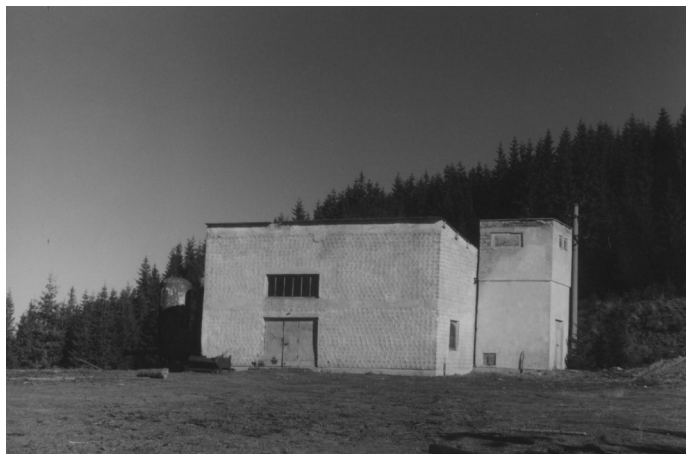
Fig. 5 Clădiri dezafectate de pe fosta platformă a exploatării Dadu.

Exploatările de la Dadu, Oița și Tolovanu au condus la o serie de modificări importante ale mediului sub diferite aspecte. Deschiderea, exploatarea și apoi sistarea lucrărilor au modificat topografia zonei. După închiderea exploatărilor au rămas echipamente abandonate, platforme dezafectate, clădiri în paragină (Fig. 5).